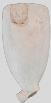
Pijp nr. 4, hielmerk: gekroonde 51.