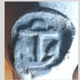
Hielmerk nr.11: Anker