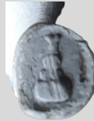
Hielmerk nr. 5, Goudse Toren.