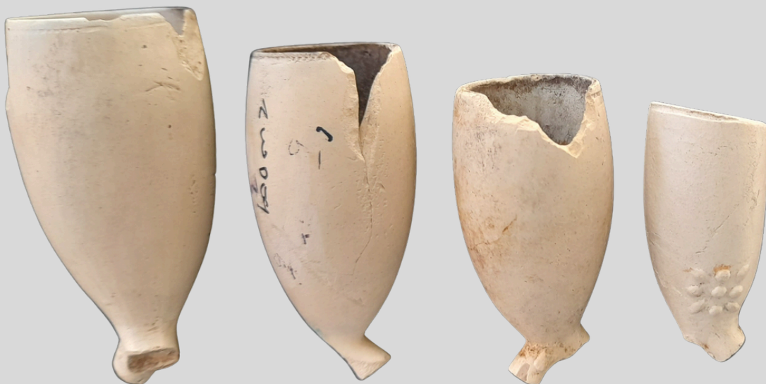
De verschillende vormen en afmetingen: nr. 4, 14,1 en 6.

Het aantal variaties in vorm, kwaliteit en decoratie is ontelbaar. Goudse pijpen waren van topklasse. Je vindt ze dan ook van Amerika tot Indonesië, veelal door de VOC en WIC verhandeld. Goudse pijpen zijn voorzien van het wapen van Gouda aan de zijkanten van de ketel bij de hiel. Een pijp van iets mindere kwaliteit was boven het wapen voorzien van een S. De betere ketels werden gepolijst met een agaatssteen, waarbij het afwerken werd gedaan door vrouwen en ook kinderen. In onze gemeente vinden we overwegend eenvoudige pijpenkoppen. Mogelijk is de zwakke economie na de Tachtigjarige Oorlog hiervan de oorzaak.