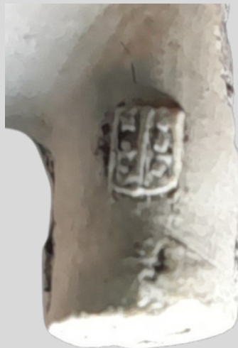
Pijpenkop met het wapen van Gouda als zijmerk.

Hulpmiddelen hiervoor zijn de hielmerken en de vorm. Het determineren is niet eenvoudig. Zo kunnen hielmerken 100 tot 150 jaar in gebruik zijn geweest. De vorm van de ketel is dan ook belangrijk, waarbij kleine afwijkingen bepalend kunnen zijn. Er wordt dan ook meestal een ruime marge aangehouden. De laatste jaren word er ook gekeken of de pijp goed doorrookt is. Dit zou namelijk iets kunnen zeggen over de welstand van de gebruiker. Welgestelde rokers hadden soms de gewoonte om een pijp na één keer roken weg te gooien. Omdat kleipijpen, zeker die met een lange steel, snel konden breken, moeten we hieraan niet al teveel waarde hechten.