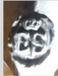
Hielmerk nr. 7: gekroonde GB