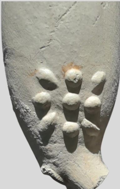
Pijpenkop nr. 6 met de afbeelding van de Tudor roos.